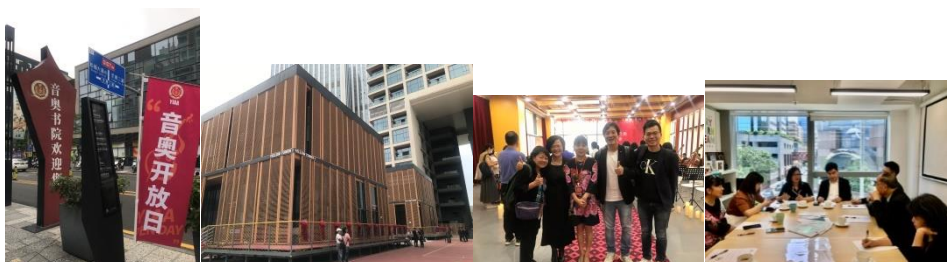
2023国内学校发展生涯规划教育的计划探讨 (杨静娴 3/8/2023)